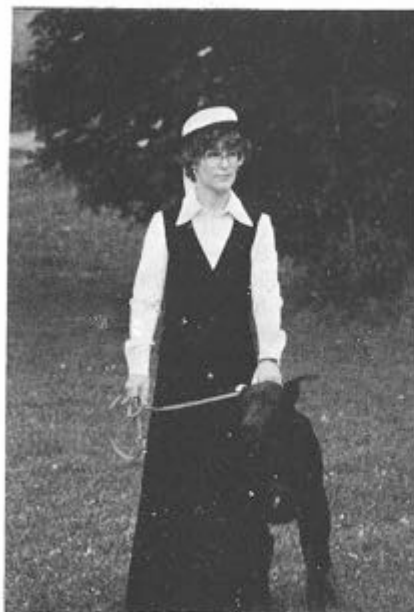
Rassehundvorführung beim Sommerfest auf der Möglingshöhe.